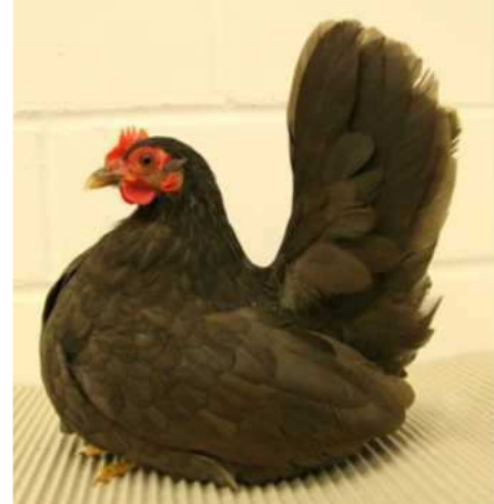
Gallina Chabo chocolate en Leipzig en 2012

He aquí el estándar EE: para ambos sexos, Pardo oscuro uniforme, particularmente brillante en el gallo. Esclavina de ambos sexos coloreadas algo más intensivamente que el resto del plumaje. Las rémiges primarias son un poco más claras que el plumaje del manto. Subplumaje de un pardo un poco más claro. Iris de color pardo, tarsos color carne, con rastros parduzcos, más oscuros en la gallina. Defectos graves: color de fondo demasiado claro o moteado, falta de brillo, tallo de las plumas aclaradas, subplumaje gris, hollín, despigmentación.