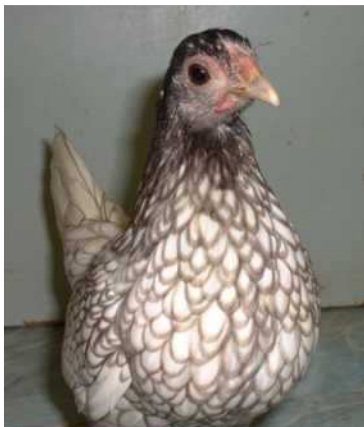
Gallina plata ribete azul