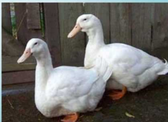
Couple de Canards Aylesbury

Los criadores deben esforzarse por preservar una buena movilidad de los animales y apartar la formación de quillas sobredimensionadas